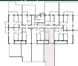
Rzut w skali 1:200