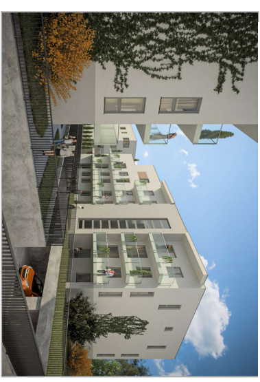
TEDEX RESIDENCE ETAP V Osiedle przy ul. Nowej 17 w Starej Wiczejnej