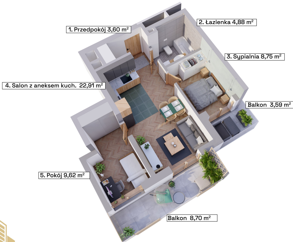
Schemat kondygnacji +3