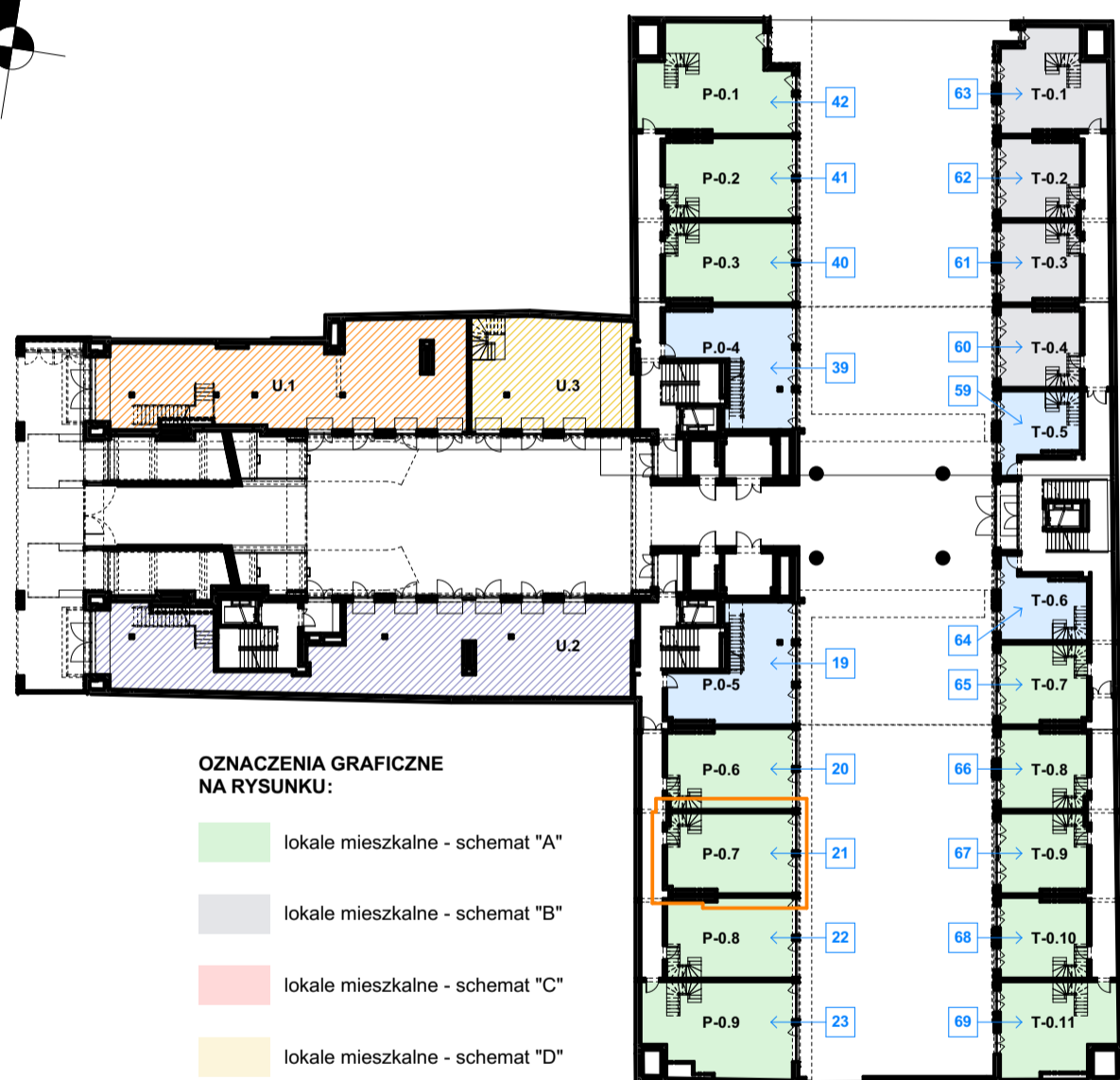
LOKALIZACJA LOKALU NA RZUCIE PARTERU skala 1:500