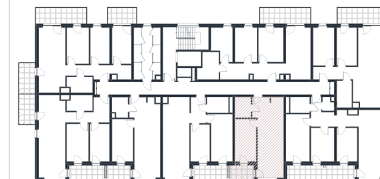
Rzut w skali 1:180