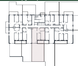
Rzut w skali 1:250