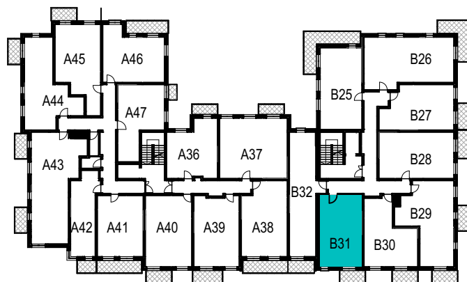
SCHEMAT ROZMIESZCZENIA LOKALI MIESZKALNYCH PIĘTRO III