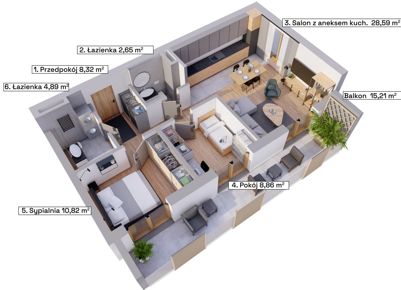
Schemat kondygnacji +2