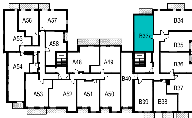
SCHEMAT ROZMIESZCZENIA LOKALI MIESZKALNYCH PIĘTRO IV