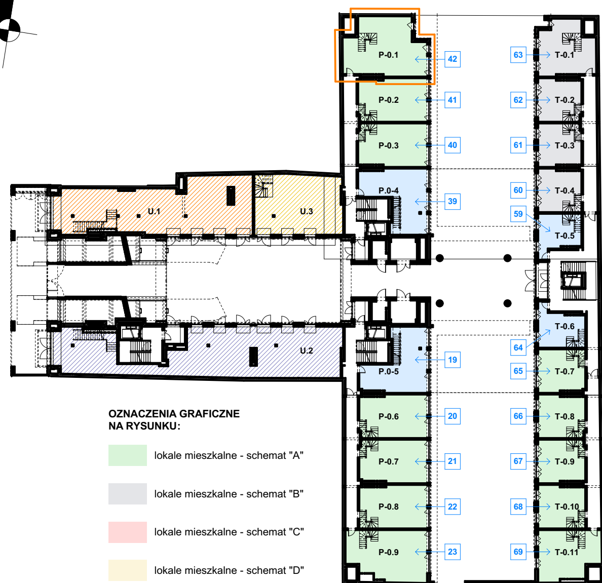
LOKALIZACJA LOKALU NA RZUCIE PARTERU skala 1:500