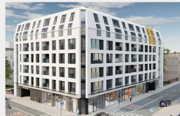
Rzut budynku od ul. Wólczańskiej