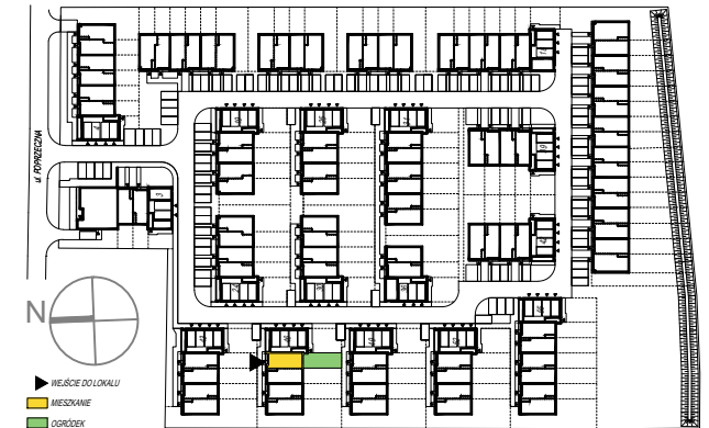
SCHEMAT PARTERU Z OGRÓDKAMI