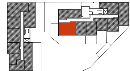
Położenie mieszkania w budynku

Warszawa, ul. Dionizosa 6A piętro 1 | klatka B