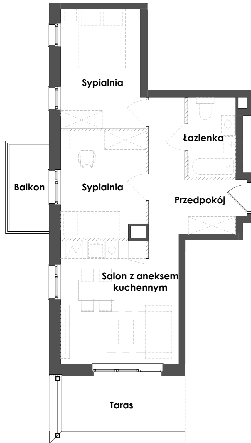
Przykładowa aranżacja lokalu