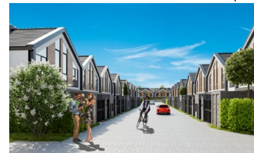
Widok od strony ulicy