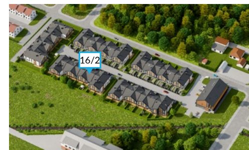
Widok osiedla z lotu ptaka