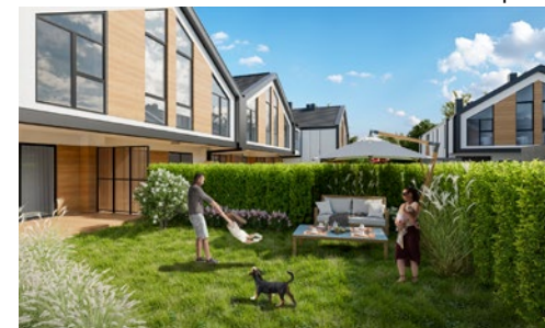
Widok od strony ogrodu