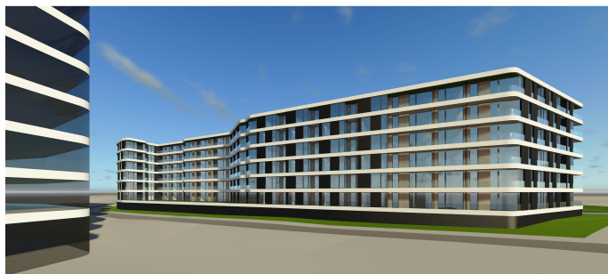
Kraków, ul. Promienistych