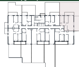
Rzut w skali 1:250