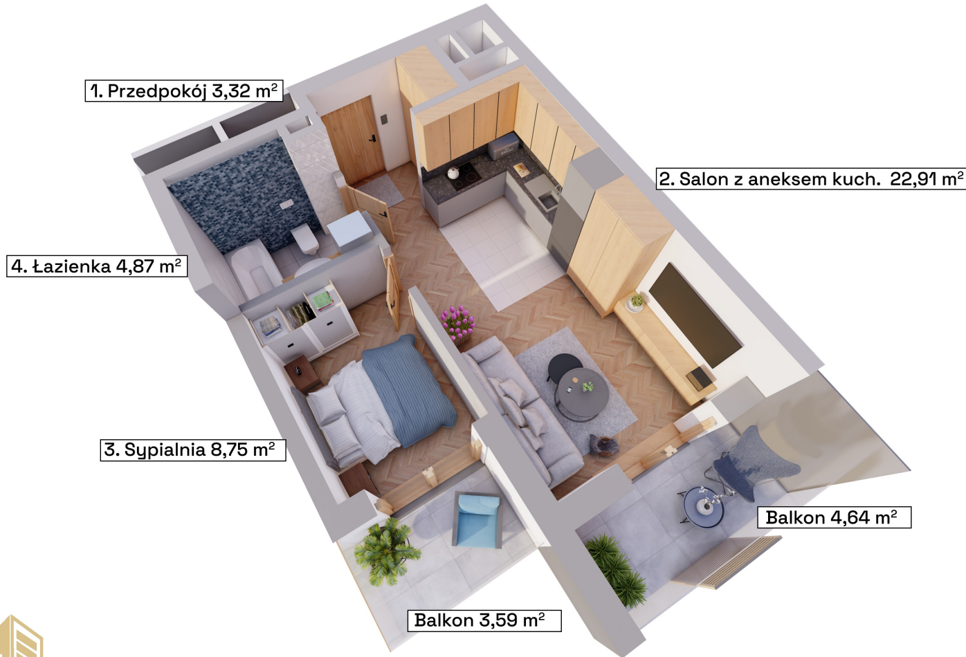
Schemat kondygnacji +1