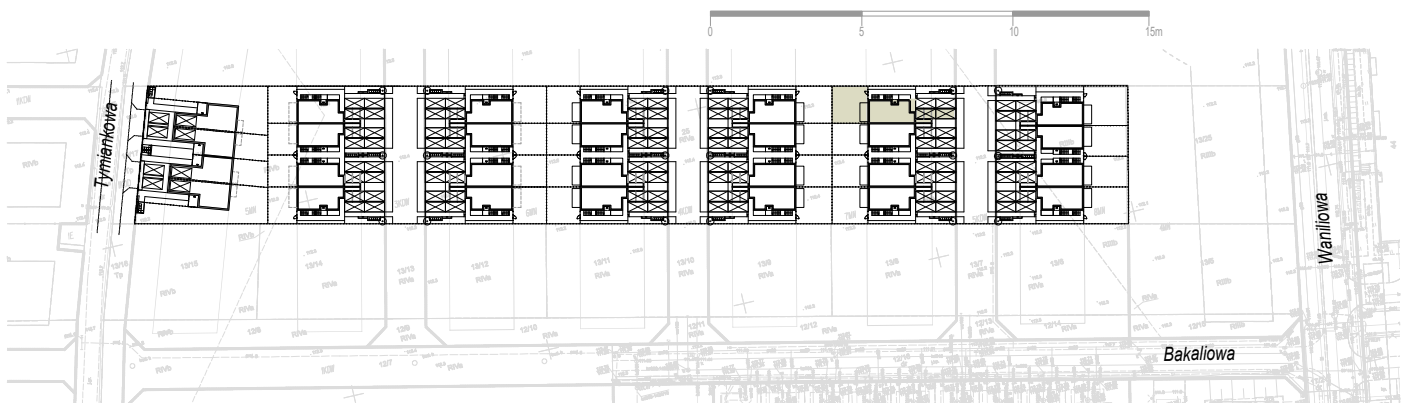
LOKALIZACJA DZIAŁKI NA OSIEDLU