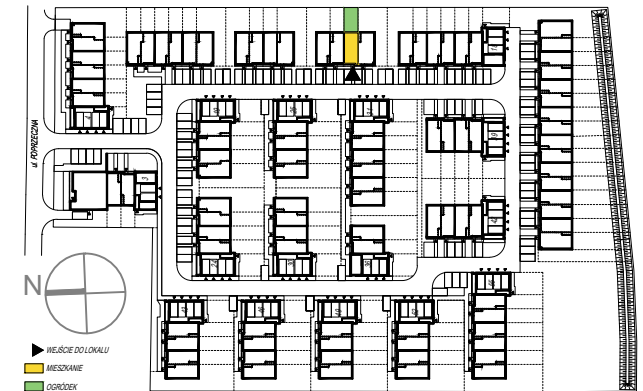
SCHEMAT PARTERU Z OGRÓDKAMI