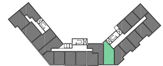
Położenie mieszkania w budynku

BIURO SPRZEDAŻY 03-151 Warszawa ul. Modlińska 309 tel. 224 878 224