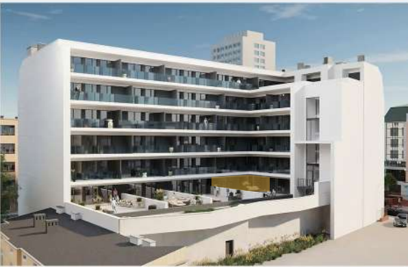
Rzut budynku od strony wewnętrznej