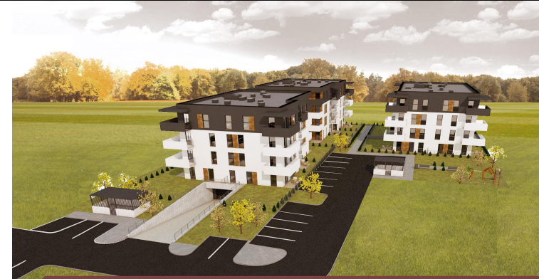
Segment L - L.3.3 Piętro III