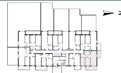
Rzut w skali 1:250