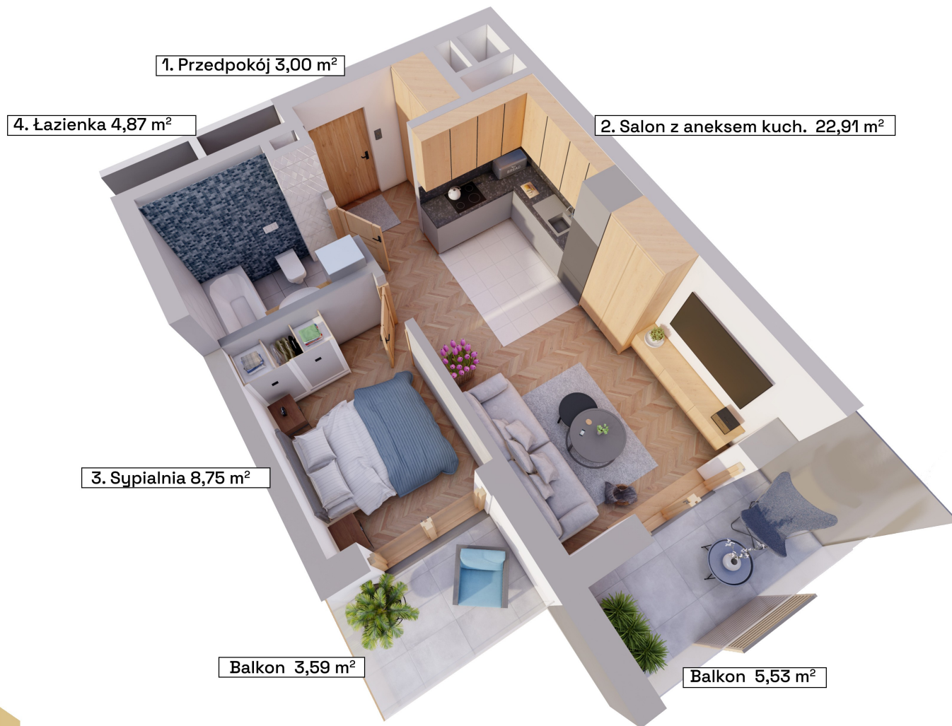
Schemat kondygnacji +1